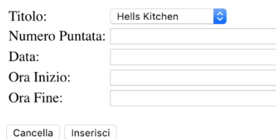
Figura 3. Esempio di form di inserimento dati

Lo chef Mario Basilico (BSLMRA85L03L219T) è stato inserito nel database. È apparso nel programma Hell's Kitchen il giorno 2016-10-26 dalle ore 8:30 alle ore 10:00.